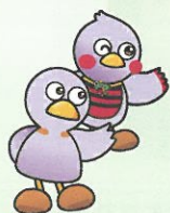
埼玉県マスコット 「コバトン」「さいたまっち」

悩んでいる人に気づき、声をかけられる人のことです。 特別な研修や資格は必要ありません。 誰でもゲートキーパーになることができます。 周りで悩んでいる人がいたら、 やさしく声をかけてみてください。 声をかけることで、 不安や悩みを和らげることに繋がります。